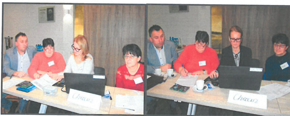
Grupa Odnowy Wsi w czasie warsztatów opracowania Sołeckiej Strategii Rozwoju. Urząd Miasta i Gminy w Żerkowie w dniach 09-10.XII.2022r.

SOLECKA STRATEGIA ROZWOJU – CHRZAN, LASKI wypracowana przez GOW na warsztatach w ramach programu UMWZ - „Wielkopolska Odnowa Wsi 2020+”