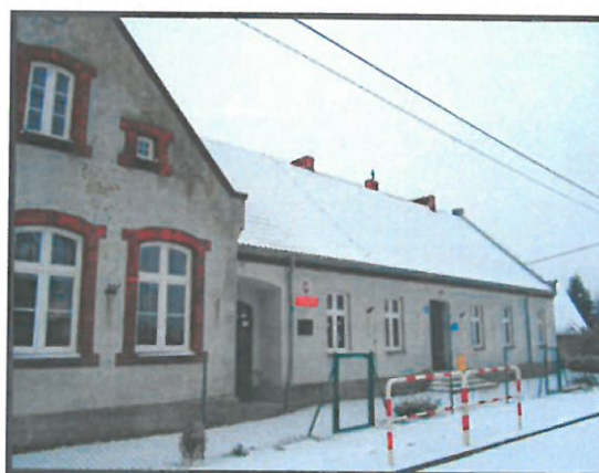
Szkoła podstawowa im. Św. Jana Pawła II