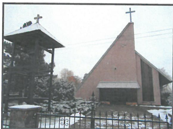
Miejsce kultu religijnego