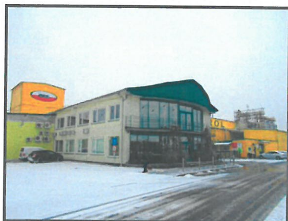
Lokalna firma NEOROL