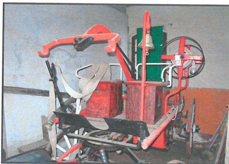
Zabytkowy konny wóz strażacki

ZASOBY – wszelkie elementy materialne i niematerialne wsi i związanego z nią obszaru, które mogą być wykorzystane obecne bądź w przyszłości w realizacji publicznych bądź prywatnych przedsięwzięć odnowy wsi. Zwrócić uwagę na elementy specyficzne i rzadkie (wyróżniające wieś). Opracowanie: Ryszard Wilezyński