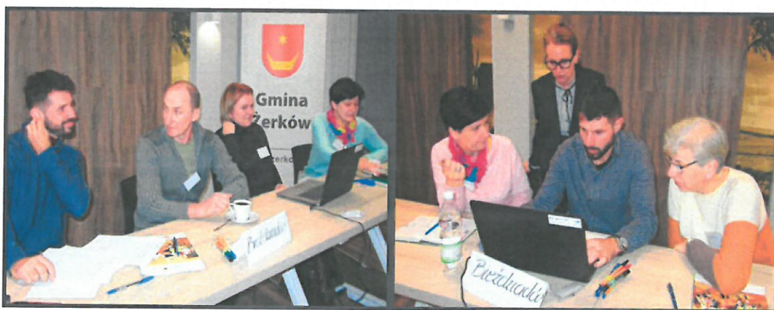
Grupa Odnowy Wsi w czasie warsztatów opracowania Sołeckiej Strategii Rozwoju. Urząd Miasta i Gminy w Żerkowie w dniach 09-10.XII.2022r.

SOŁECKA STRATEGIA ROZWOJU – BIEŻDZIADÓW wypracowana przez GOW na warsztatach w ramach programu UMWW - „Wielkopolska Odnowa Wsi 2020+”