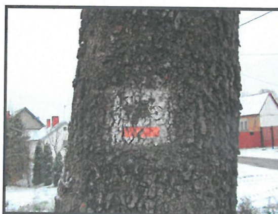
Oznakowany szlak rowerowy