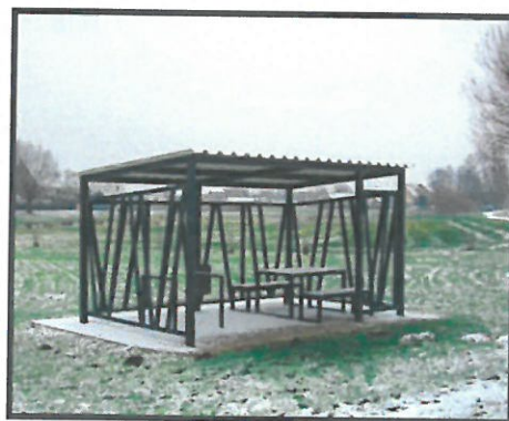
Wiata rowerowa z okienkami informacyjnymi o miejscowości

SOLECKA STARTEGLIA ROZWOJU – BIEŻDZIADÓW wypracowana przez GOW na warsztatach w ramach programu UMWV - „Wielkopolska Odnowa Wsi 2020+”