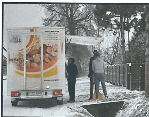
Handel obwoźny w sołectwie