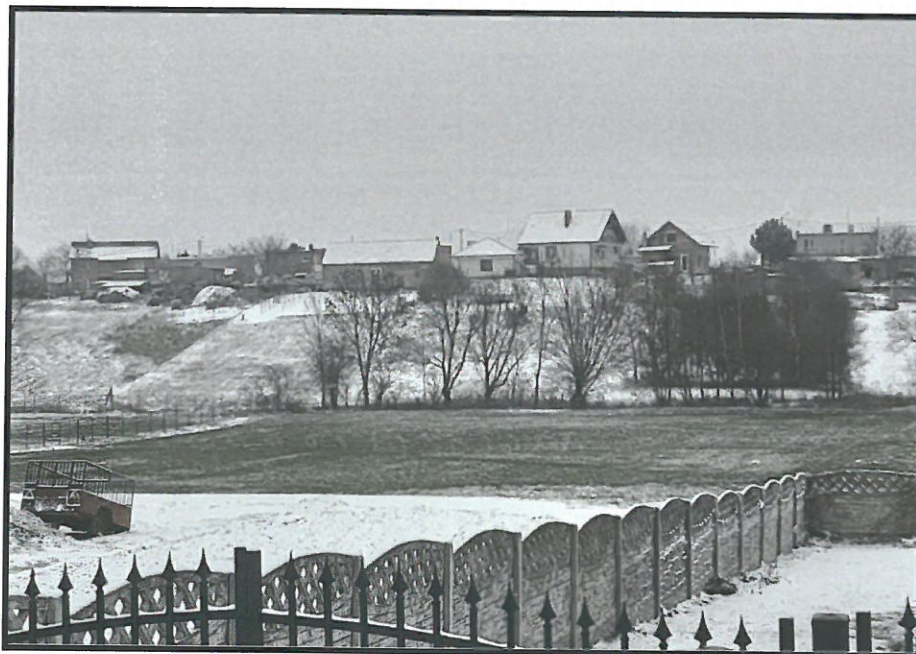
Ciekawie ukształtowany teren sołectwa

SOŁECKA STRATEGIA ROZWOJU – STĘGOSZ wypracowana przez GOW na warsztatach w ramach programu UMWW - „Wielkopolska Odnowa Wsi 2020+”