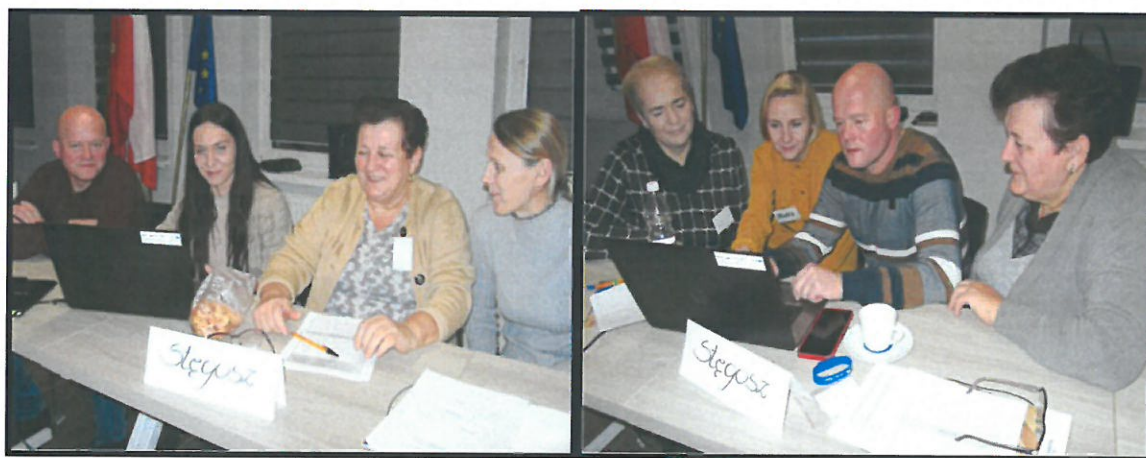
Grupa Odnowy Wsi w czasie warsztatów opracowania Sołeckiej Strategii Rozwoju. Urząd Miasta i Gminy w Żerkowie w dniach 09-10.XII.2022r.

SOŁECKA STRATEGIA ROZWOJU – STĘGOSZ wypracowana przez GOW na warsztatach w ramach programu UMWW - „Wielkopolska Odnowa Wsi 2020+”