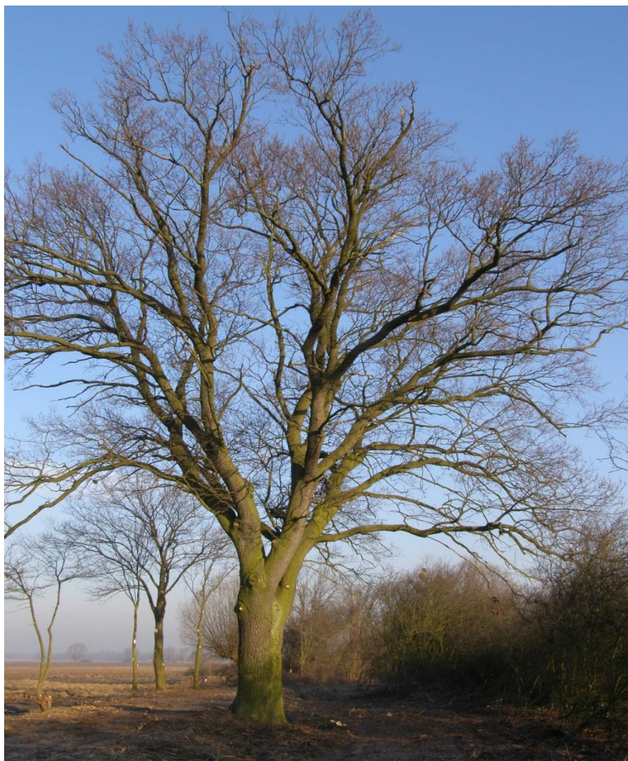
Fot. 14_dąb szypułkowy