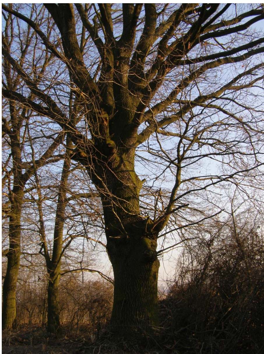
Fot. 08_dąb szypułkowy