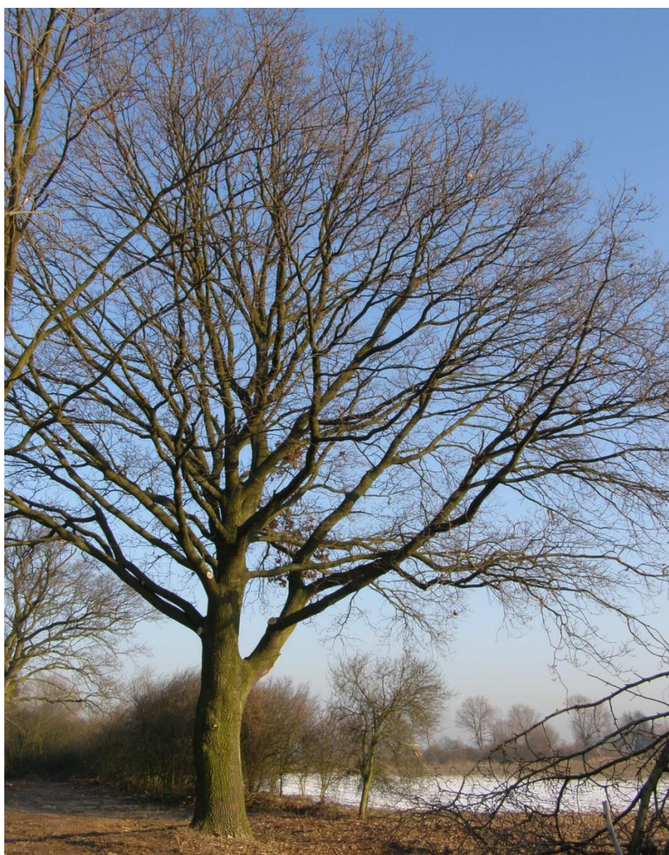
Fot. 13_dąb szypułkowy