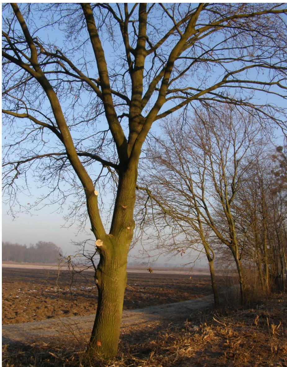
Fot. 06_dąb szypułkowy